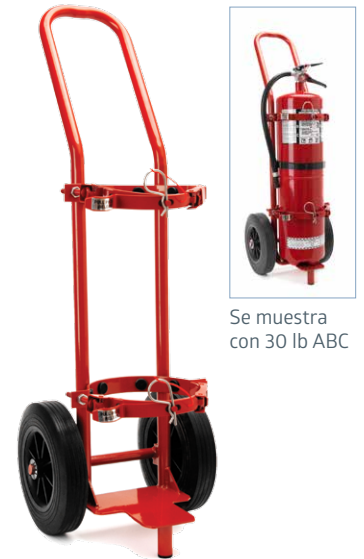
Se muestra con 30 lb ABC